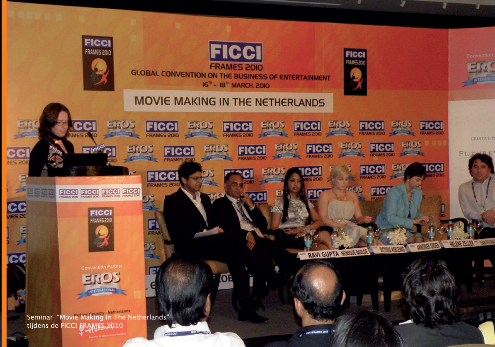
Seminar "Movie Making In The Netherlands" tijdens de FICCI FRAMES 2010